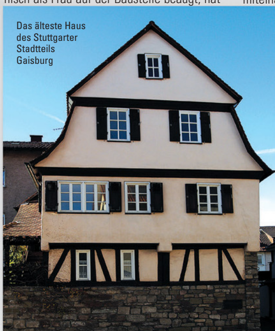
Das älteste Haus des Stuttgarter Stadtteils Gaisburg

Das neueste „Aufträge“ des schwäbischen Ehepaars war die Parkettbodenrenovierung im ältesten Haus von Stuttgart-Gaisburg. Zum Einsatz kamen die HUMMEL (Körnung 36/50/100) und ein RANDMEISTER (Körnung 40/80) sowie für den Zwischenschliff die FIN (Körnung 100). Zur Oberflächenbehandlung verwendete Herr Biedermann Oll Pur 60, ein PU-Öl aus Italien, das sehr gut aushärtet und die Holzfarbe intensiviert. Wir wünschen dem Ehepaar Biedermann noch wei-