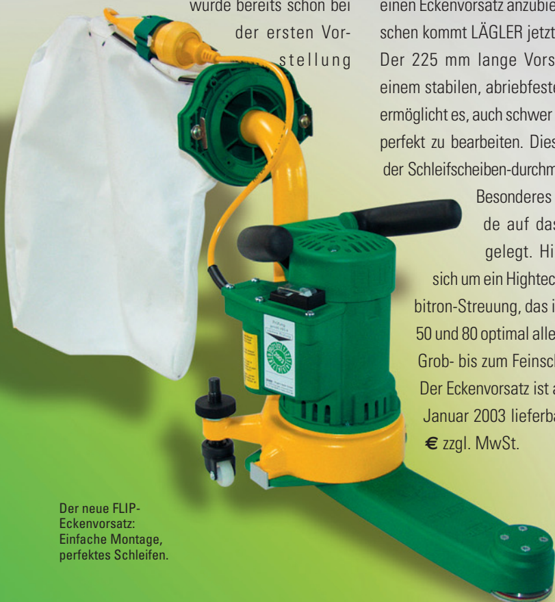
Der neue FLIP-Eckenvorsatz: Einfache Montage, perfektes Schleifen.

Der Eckenvorsatz ist ab Ende Januar 2003 lieferbar und kostet 136 € zzgl. MwSt.