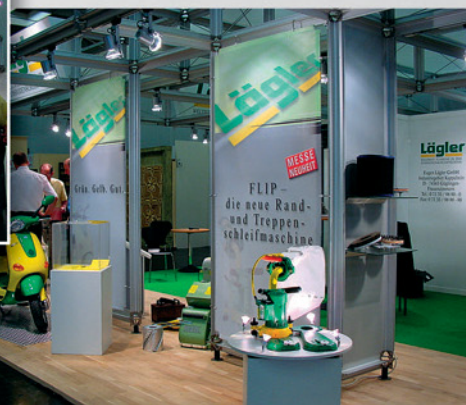
Messe-Impressionen Interzum 2001